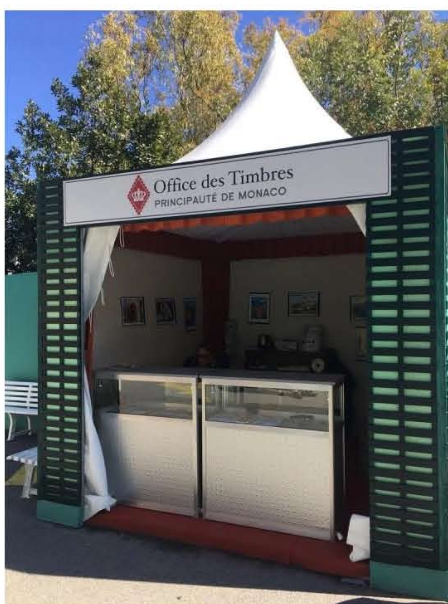
Stand dedicato ai francobolli stampati dal Principato di Monaco

Tra un incontro e l'altro il pubblico si perde tra i tanti stand, la maggior parte dei quali espone articoli sportivi, su tutti spicca l'angolo dedicato agli eleganti completi Sergio Tacchini , main sponsor del torneo. Sparse ovunque ci sono poi le boutique ufficiali del Rolex Masters , dove l'articolo più richiesto è il panama con logo dell'evento venduto al costo di € 25.00. A Monaco non manca però un particolare corner dedicato ai diversi francobolli stampati negli anni proprio dal Principato.