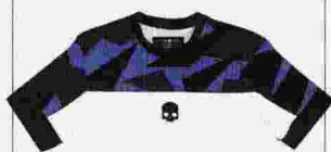
HYDROGEN TECH CAMO T-SHIRT linea camouflage usata da Fabio Fognini ● 75 euro

a cura di Fabrizio Scavi gazzalook@gazzetta.it