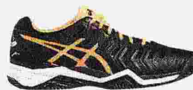
ASICS GEL RESOLUTION gestiscono la forza per i cambi di posizione ● 147 euro