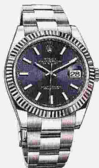
ROLEX DATEJUST 41 OYSTER PERPETUAL in acciaio, diametro 41 ● 8.700 euro