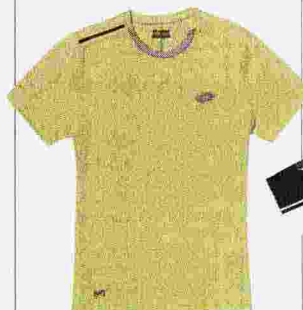
LOTTO T-SHIRT in tessuto tecnico traspirante ● 45 euro