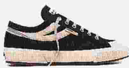
SUPERGA PANATTA SNEAKER con tomaia in cotone e suola in gomma naturale ● 79 euro