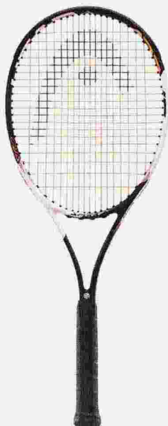
HEAD GRAPHENE XT Novak Djokovic la consiglia, dà potenza e tocco insieme ● 269 euro

a cura di Fabrizio Scavi gazzalook@gazzetta.it