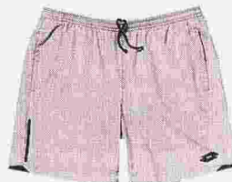
LOTTO PANTALONCINO in microfibra grigio doppiato blu ● 40 euro