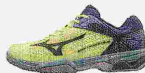
MIZUNO WAVE EXCEED TOUR 2 leggera, reattiva, grande ammortizzazione ● 145 euro