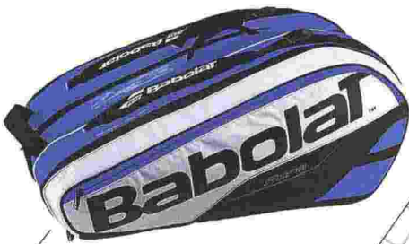
BABOLAT Borsone Rh 12 Pure Drive utilizzato dalla spagnola Garbiñe Muguruza (€ 89,95)