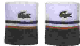
LACOSTE Banda (€ 15) e polsini (€ 15) in misto cotone fantasia