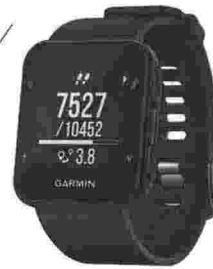
GARMIN Smartwatch multifunzione pensato per lo sport e fitness e dotato di Gps (€ 199,99)