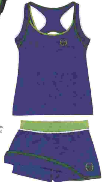
TACCHINI Completo da tennis nella versione Roland Garros in jersey mesh a prova di raggi UV e di rapida asciugatura (€ 85)