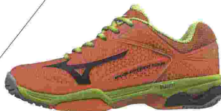
MIZUNO Calzatura da tennis Wave Exceed Tour 2 con tomaia in 3D-Solid (€ 145)