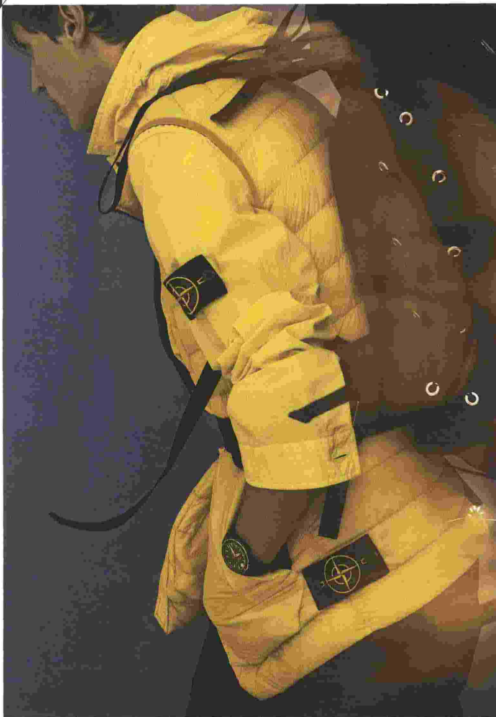
Gilet in nylon imbottito in piuma (€ 300), camicia in tela di cotone (€ 270) e cargo in twill di cotone (€ 270), tutto Stone Island . Zaino in tessuto tecnico, Prada (€ 1.700). Orologio Clifton Club con cassa in acciaio e cinturino in caucciù, Baume&Mercier (€ 2.250).

GROOMING: MATTEO BARTOLINI AT FREELANCER