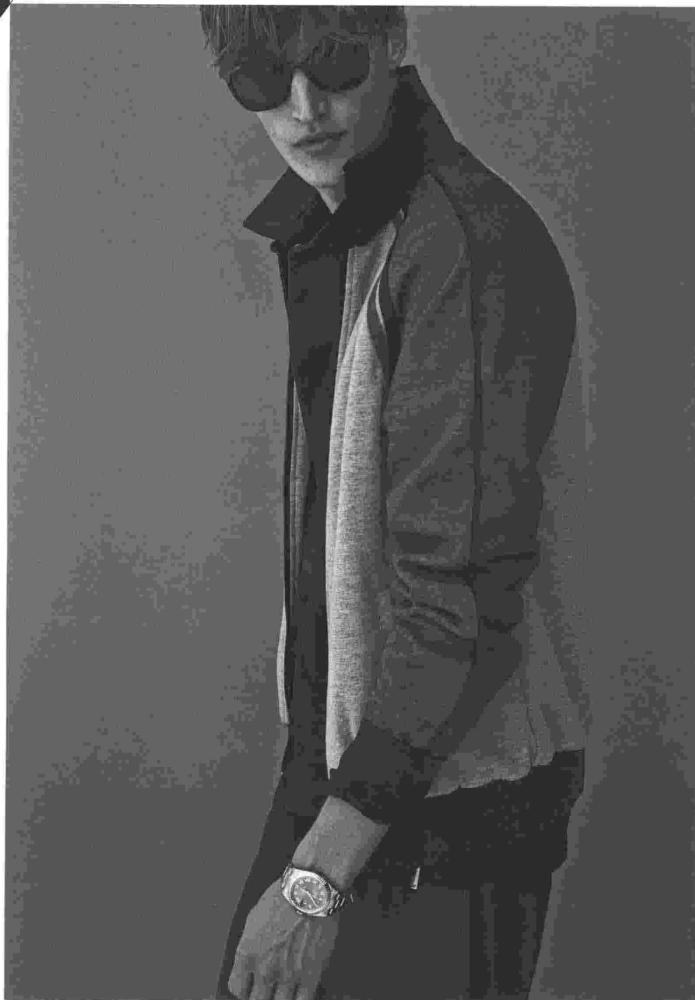
Blouson in misto cotone, Sergio Tacchini (€ 70). Camicia e pantaloni in nappa e suede, Emporio Armani (prezzi su richiesta). Occhiali da sole in acetato e metallo, Ermenegildo Zegna Eyewear (€ 230). Orologio Oyster Perpetual Datejust con cassa in Rolesor (acciaio e oro bianco), Rolex (€ 8.700)