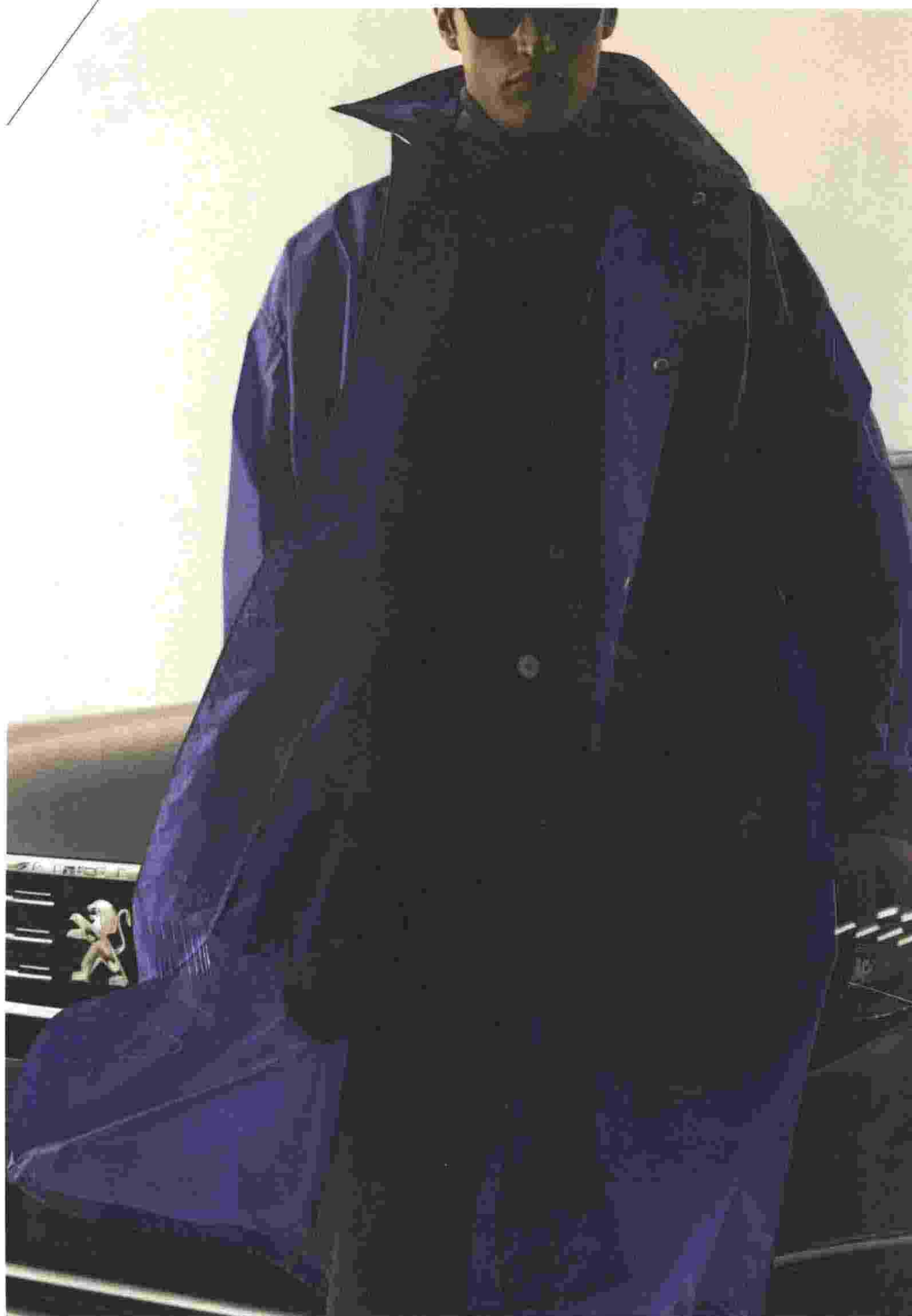
Spolverino in rip-stop di nylon (€ 990) e dolcevita in lana moulinè (€ 420), Prada . Abito in cotone melange, Manuel Ritz (€ 425). T-shirt in Merino Wool Tek, Australian (€ 79). Occhiali da sole in metallo Dior Homme (prezzo su richiesta). Auto Peugeot 5008.