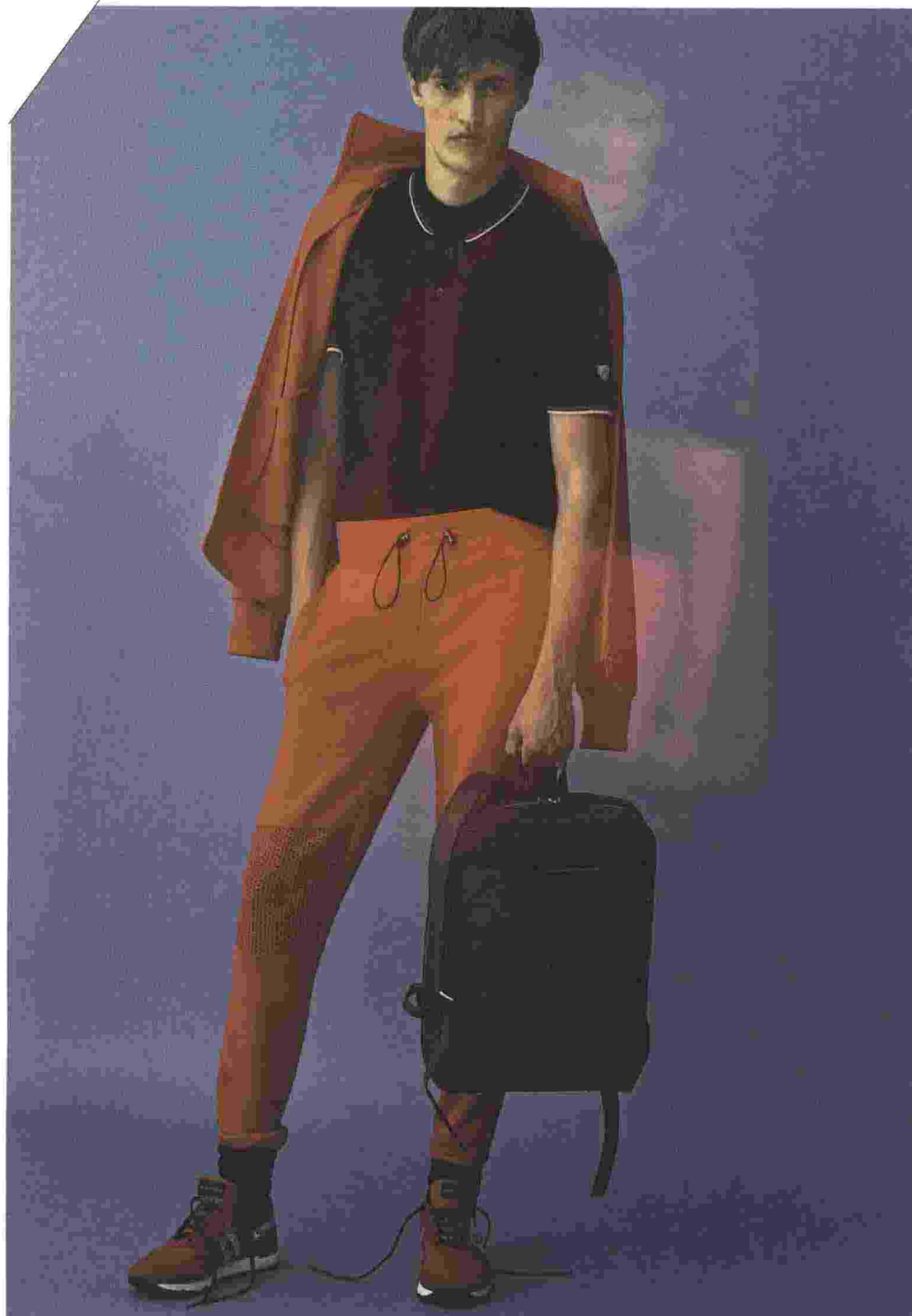
Tuta in triacetato, Hydrogen (€ 350). Polo in cotone, Falconeri (€ 157). Sneakers in tessuto tecnico e suola in EVA, Ruco Line (€ 300). Zaino in pelle, Nava Design (prezzo su richiesta). Calze in cotone, Calzedonia (prezzo su richiesta).