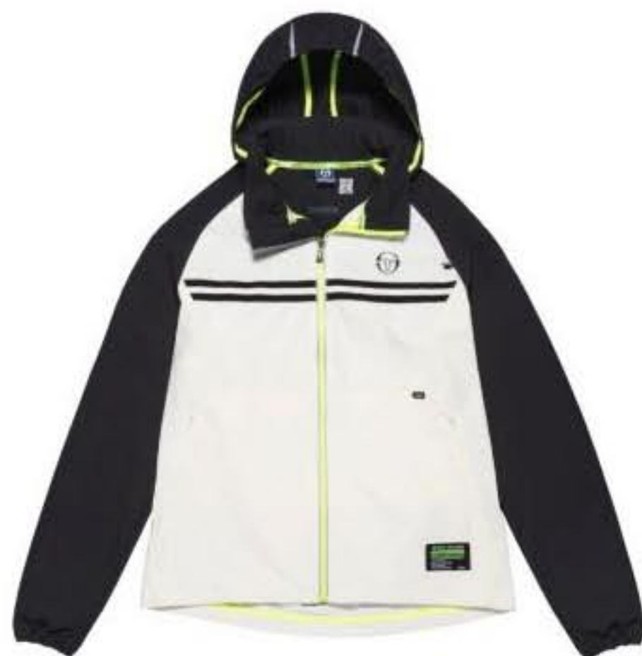
Giacca in tessuto tecnico con loops per il passaggio dei cavetti delle cuffie, Sergio Tacchini