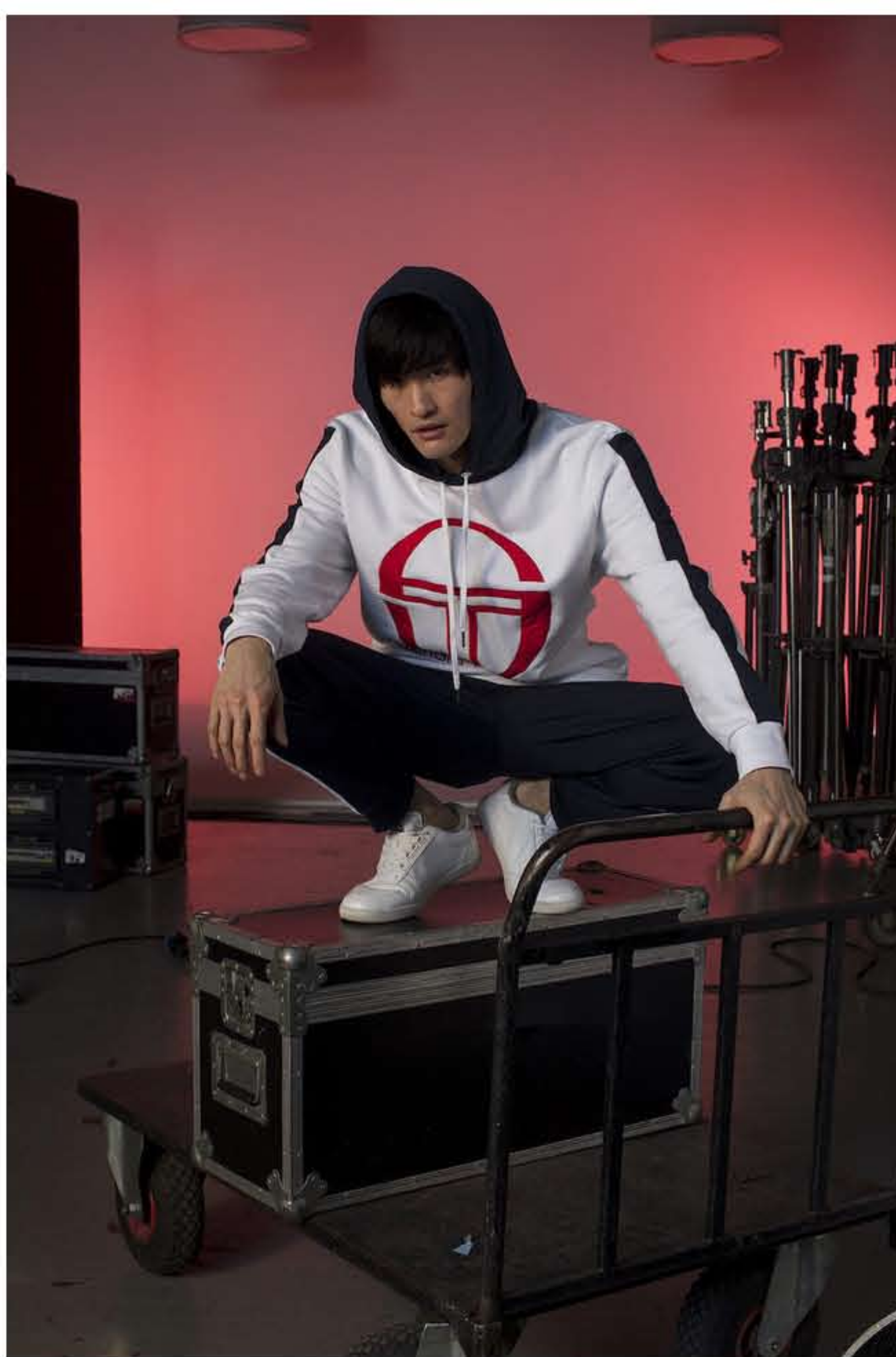
Un look firmato Sergio Tacchini

Wintex Italia S.r.l., la società che gestisce il marchio Sergio Tacchini nel mondo, ha firmato con il gruppo vicentino UBC-United Brands Company S.p.A. un contratto pluriennale che affida alla società specializzata in sviluppo, produzione e distribuzione di linee di scarpe sportive, anche la licenza per la produzione della linea di abbigliamento Sergio Tacchini e la relativa distribuzione nella cosiddetta area DACH (Germania, Austria e Svizzera).