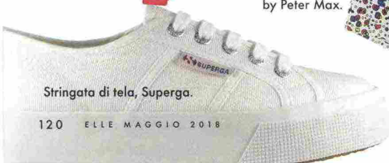
Stringata di tela, Superga.