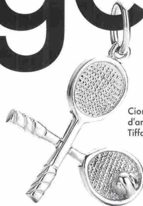
Ciondolo d'argento, Tiffany & Co.