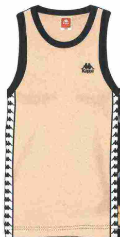
Canotta con bande logate, Kappa. A destra. Farrah Fawcett in pattini a rotelle, calzettoni e piega perfetta.