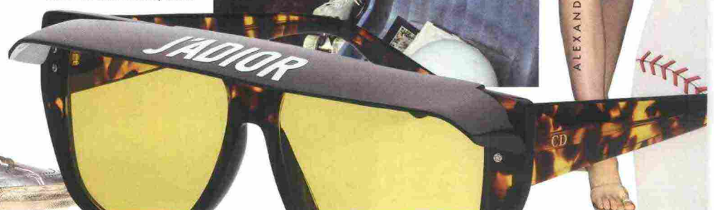
Occhiali con visiera, Dior.