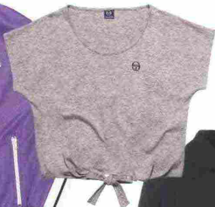
T-shirt col nodo, Sergio Tacchini. Sotto, felpa con cappuccio, Champion.