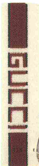
Sopra. Felpa tricolore, Levi's. A sinistra. Fascia di spugna da tennista, Gucci. Sotto. Basket shoe, Golden Goose Deluxe Brand.