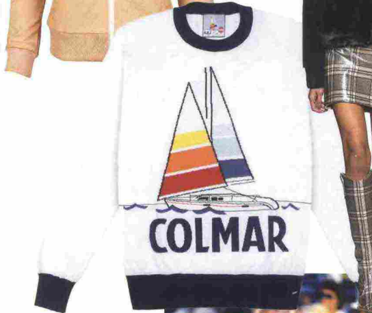
Pull di cotone, Colmar Originals by Au Jour Le Jour. A destra, Chris Evans in total look Ellesse.