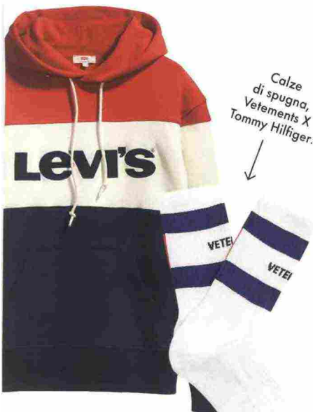
Calze di spugna, Vetements X Tommy Hilfiger.