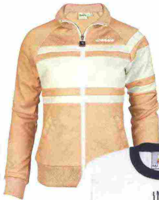
Giubbino zippato con collo e polsi di maglia, Diadora.