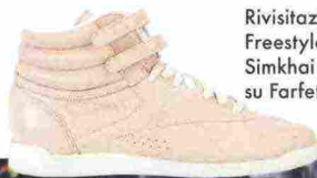
Rivisitazione del modello Freestyle HI, Jonathan Simkhai X Reebok su Farfetch.com.