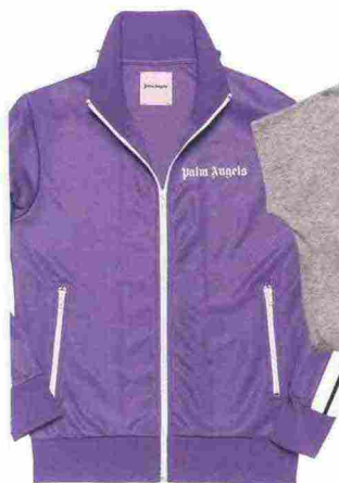
Tuta a tinte bonbon, Palm Angels.