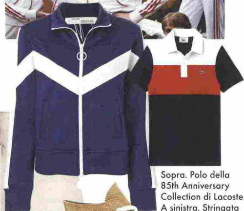
Sopra. Polo della 85th Anniversary Collection di Lacoste. A sinistra. Stringata di suède, J.W. Anderson X Converse.