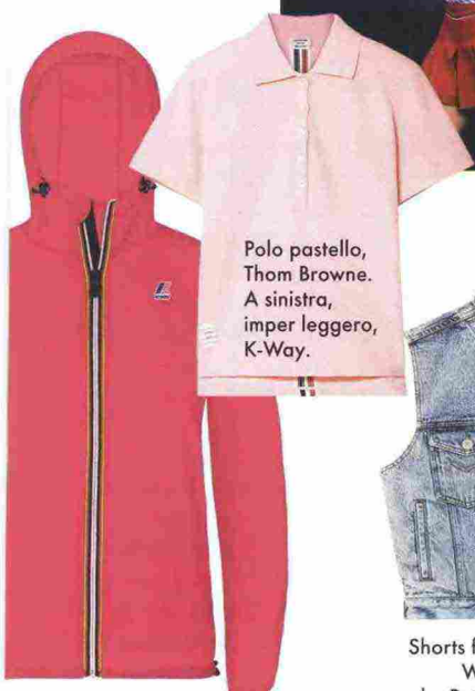
Polo pastello, Thom Browne. A sinistra, imper leggero, K-Way.