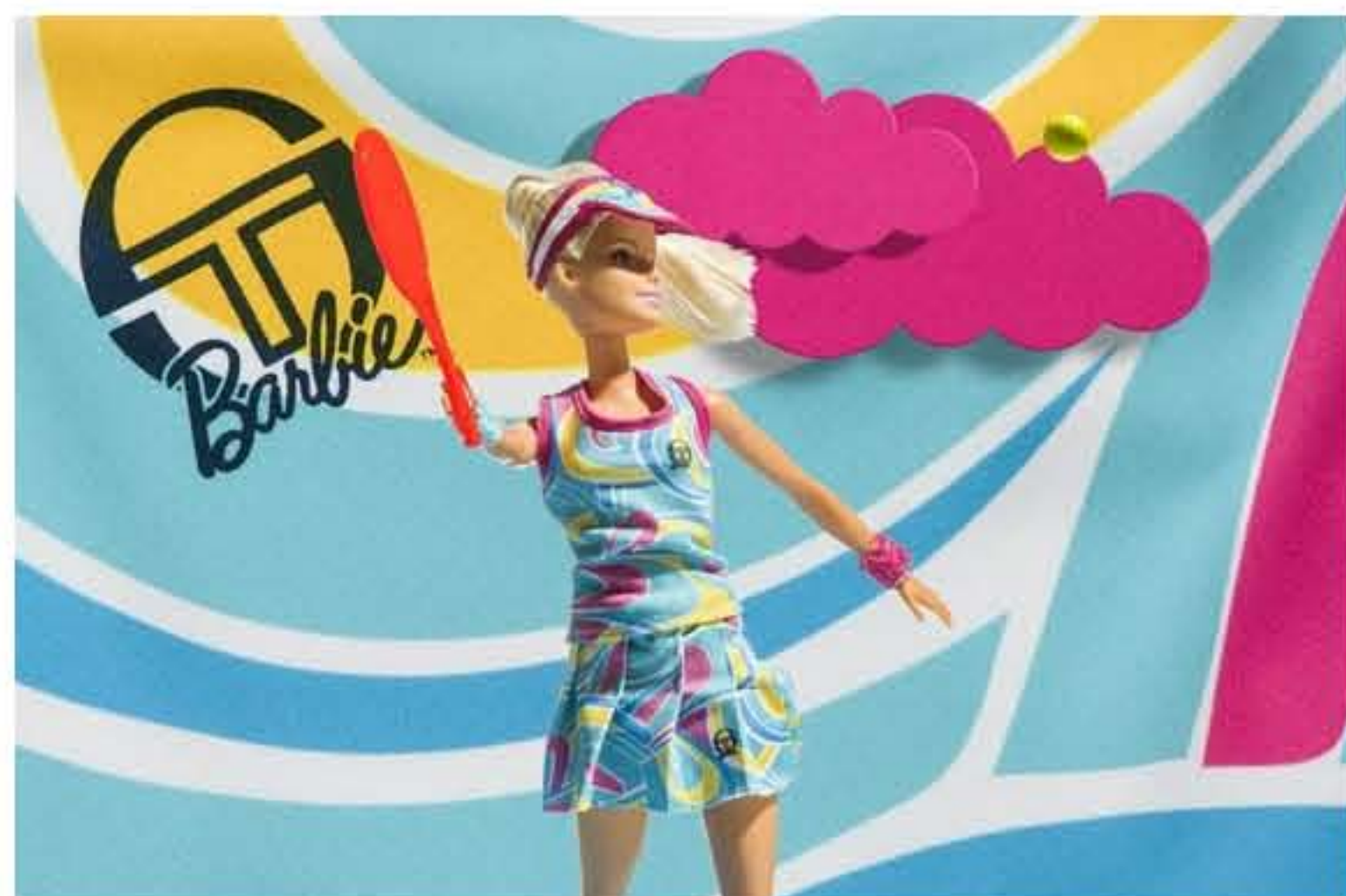
La Barbie Sergio Tacchini

Per l'occasione Magia 2000, ovvero gli Italian Barbie Designer for Special Events , hanno creato una versione in miniatura del completo da tennis per la bambola icona, corredato da accessori e props come fosse una bambola da collezione.