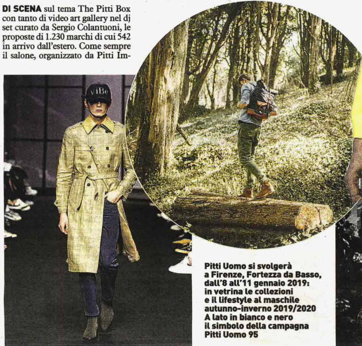
Pitti Uomo si svolgerà a Firenze, Fortezza da Basso, dall'8 all'11 gennaio 2019: in vetrina le collezioni e il lifestyle al maschile autunno-inverno 2019/2020. A lato in bianco e nero il simbolo della campagna Pitti Uomo 95