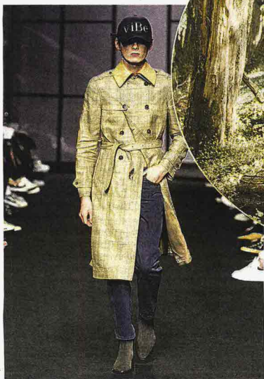
Pitti Uomo si svolgerà a Firenze, Fortezza da Basso, dall'8 all'11 gennaio 2019: in vetrina le collezioni e il lifestyle al maschile autunno-inverno 2019/2020. A lato in bianco e nero il simbolo della campagna Pitti Uomo 95