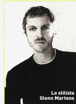
Lo stilista Glenn Martens

Tra i 1.230 marchi ne arriveranno 542 dall'estero