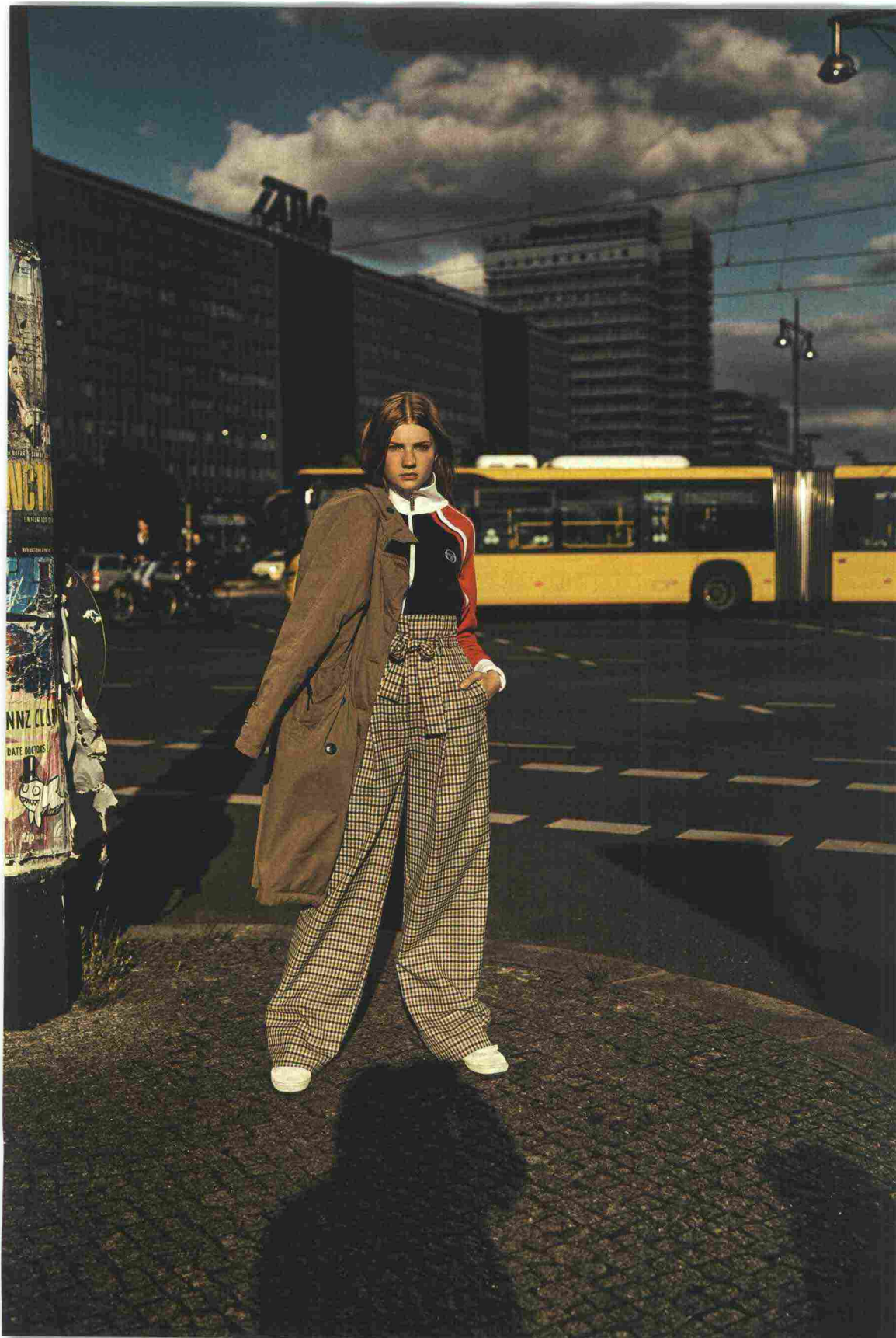
Giacca lunga imbottita, Peuteray € 699; felpa zippata, Sergio Tacchini € 60; pants a vita alta con fucsia, Erika Cavallini; sneakers Superga.