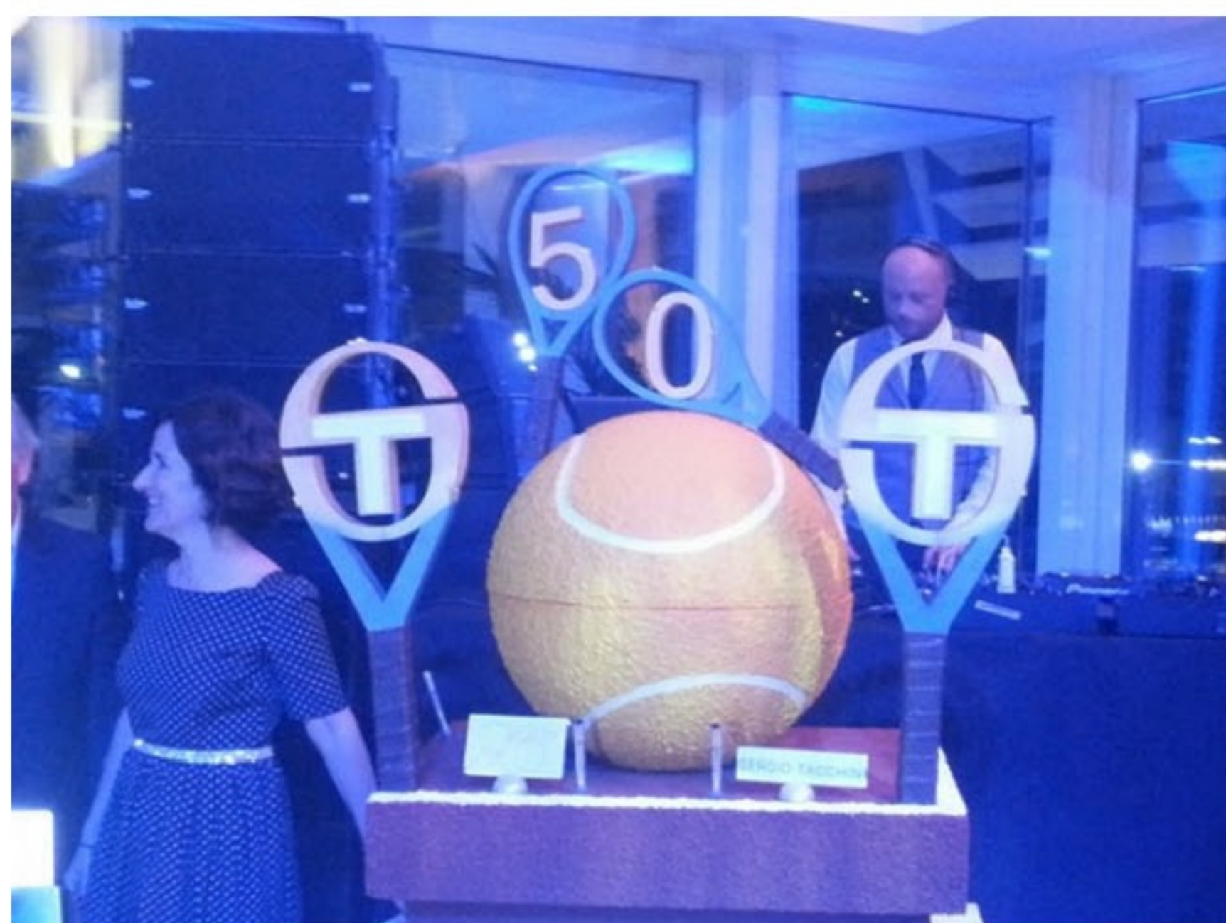
La torta che celebra i 50 anni del connubio tra Sergio Tacchini e il tennis

Presso l'esclusiva Ballroom dello Yacht Club di Monaco, si è svolta giovedì una serata di gala per celebrare i 50 anni del marchio Sergio Tacchini. Le foto di Ilie Nastase, Jimmy Connors, Pete Sampras e Novak Djokovic