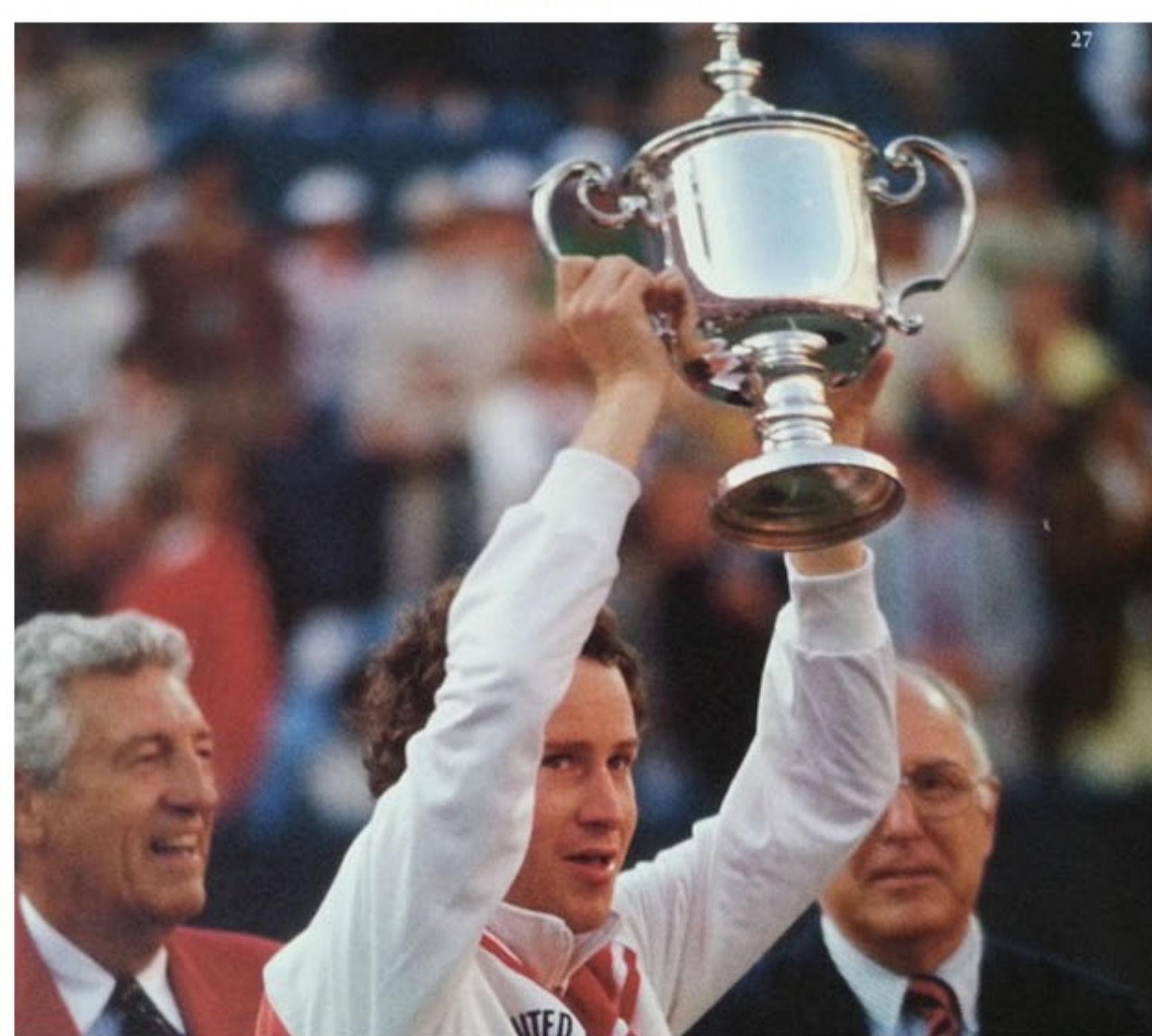
John McEnroe solleva il trofeo dello US Open 1984