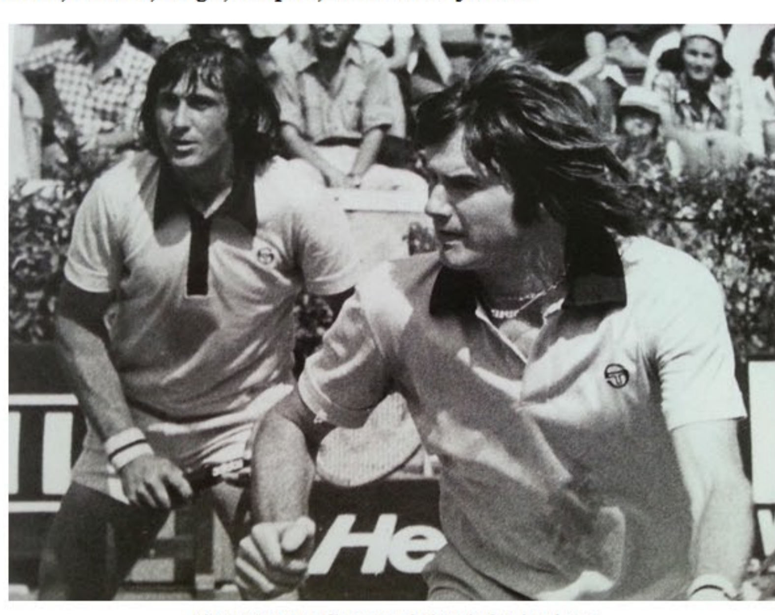
Jimmy Connors e Ilie Nastase insieme in doppio nel 1975

Sessant'anni dopo, il marchio continua a essere uno dei più riconosciuti nello sport e nel mondo della racchetta, (come testimoniano le nuove linee di questa stagione). Per l'occasione, è stata allestita e presentata una mostra fotografica che raffigura i più grandi campioni degli ultimi 40 anni, immortalati dall'obiettivo esperto del fotografo Gianni Ciaccia, che da decenni segue il torneo del Principato e tutti quelli più importanti, Slam compresi. Alla mostra erano presenti gli inviati di Ubitennis, ecco quindi alcune foto del catalogo ufficiale (dal titolo "An history made of images - Sergio Tacchini by Gianni Ciaccia" ), che ripercorre le varie epoche del tennis dagli anni '70 ad oggi, passando per i campioni che hanno scelto il marchio dell'azienda tessile di Novara come Nastase, Connors, Tanner, Gerulaitis, McEnroe, Cash, Wilander, Sabatini, Hingis, Sampras, Ivanisevic e Djokovic.