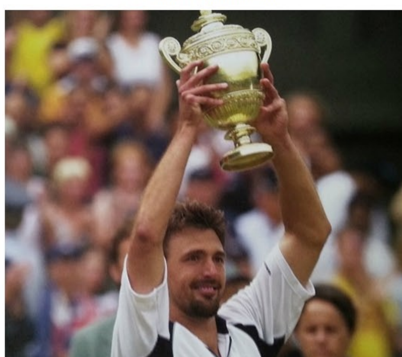
Goran Ivanisevic col trofeo di Wimbledon 2001