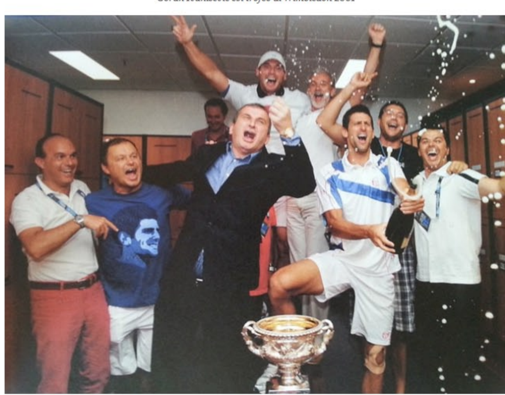
Il clan Djokovic festeggia la vittoria all'Australian Open 2011