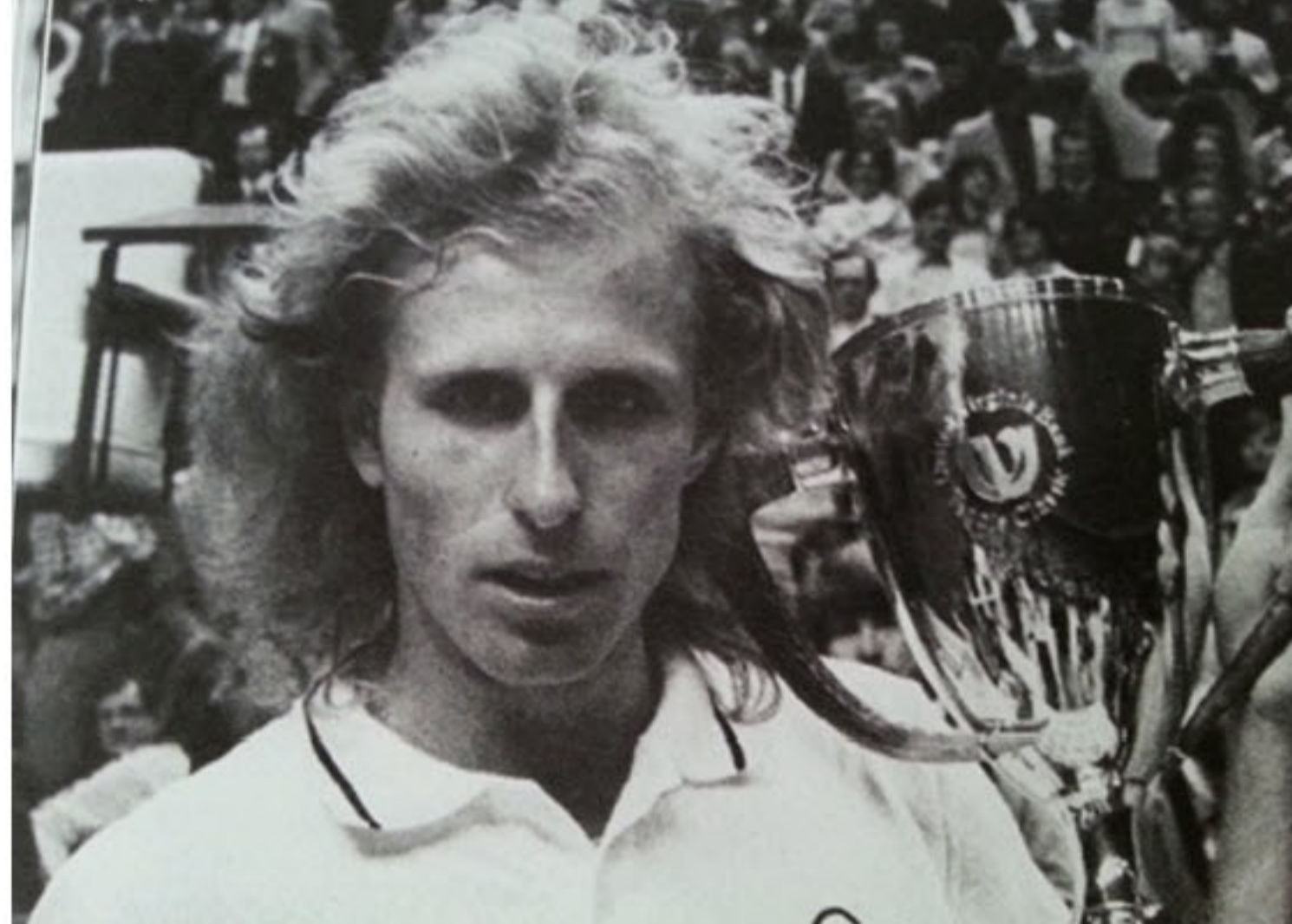
Vitas Gerulaitis nel 1978