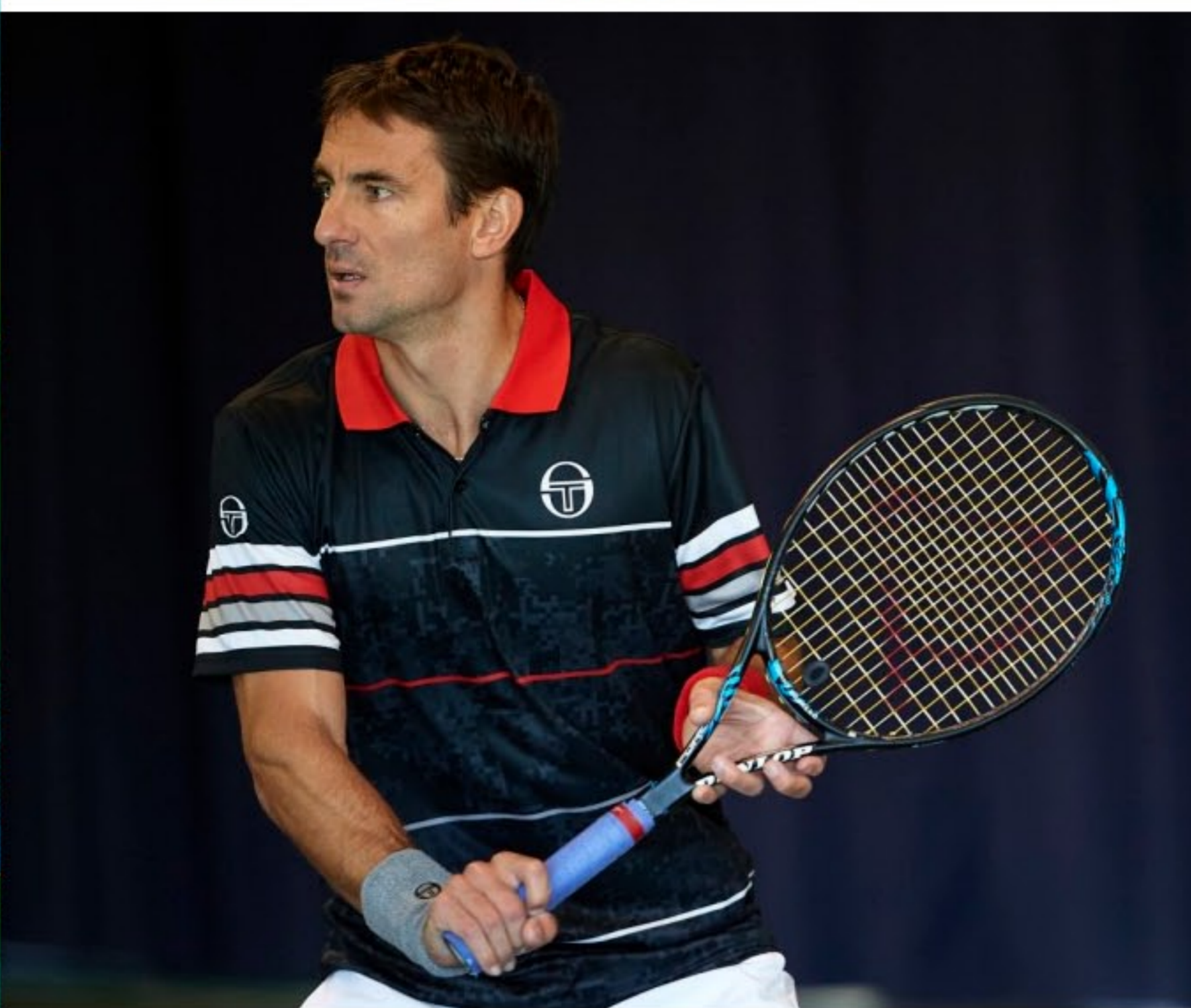
BARCELONA, SPAIN - NOVEMBER 23: Tommy Robredo for Sergio Tacchini on November 23, 2015 in Barcelona, Spain.

Il primo Grande Slam dell'anno nuovo sarà l'occasione, per Sergio Tacchini, di presentare la nuova linea tennis da uomo e debuttare con la nuova collezione tennis donna.