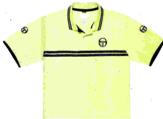
La nuova polo Tacchini ha come tema i raggi della bicicletta

Grande fermento per Selle Italia, che si prepara alla sua prima volta a Pitti Uomo, per la 91ª edizione che si terrà dal 10 al 13 gennaio a Firenze. E per il suo debutto sarà protagonista per rivoluzionare il mondo del ciclismo urban con Net, la sella ecochic che si è aggiudicata il premio di Prodotto Green dell'anno a CosmoBike 2016. Comoda e traspirante, riciclabile al 100% e assemblata a incastro senza l'uso di colle o materiali tossici, è composta da tre strati a nido d'ape: la calotta, l'imbottitura e il rivestimento in materiale termoplastico. L'EVA, nell'imbottitura consente maggiore ammortizzazione mentre gli strati di rete offrono ventilazione, traspirazione e comfort. Le fibre della maglia in polipropilene garantiscono grande resistenza all'acqua. Ma la particolarità, oltre alla leggera profumazione di lavanda, è che offre un mix di soluzioni intercambiabili: la copertura di rete è stampabile e personalizzabile, per dare libero sfogo alla fantasia. www.selleitalia.com